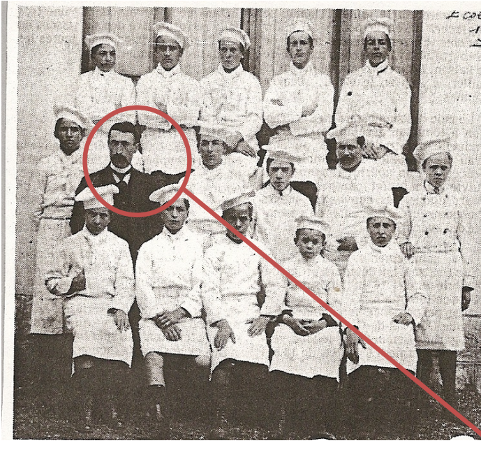
Fig. 2 : Promotion 1915-1916 : (15 ou 16 élèves)