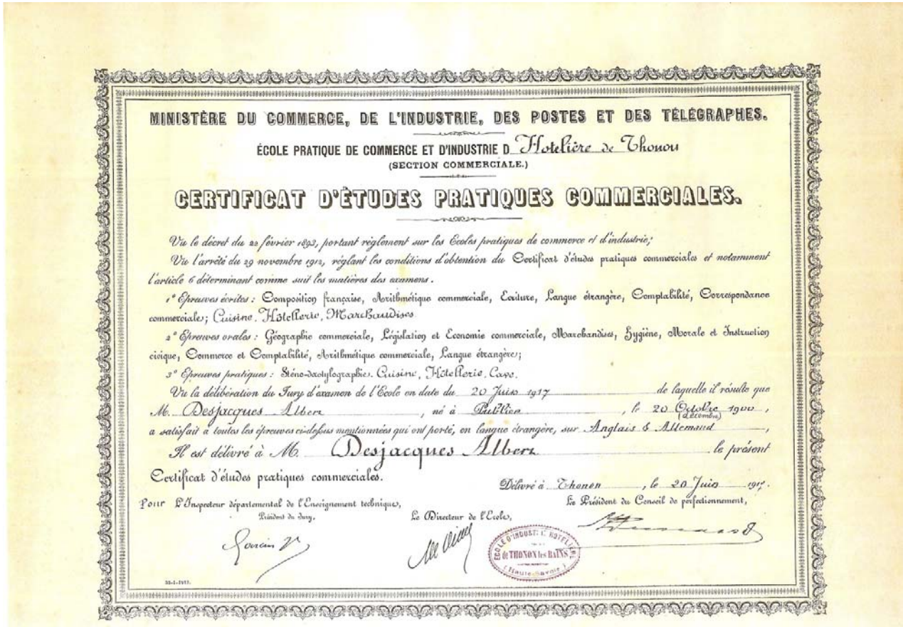
Fig. 3 : Diplôme de fin d'études de l'école hôtelière de Thonon, juin 1917